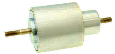
Darstellung im unbestromten Zustand

Zylindermagnet in Industriequalität. Tauchkern wartungsfrei gelagert, definierte Anschlagpositionen, Hubweg 15 mm, schallreduziert, geringes Lagerspiel. Bereits bei 100% rel. ED hohe Endkraft bei vollem Hub. Befestigung über stirnseitige Gewindebohrungen. Für anspruchsvolle Industrieanwendungen. Ausgelegt für 2 - 3 Mio Schaltzyklen.