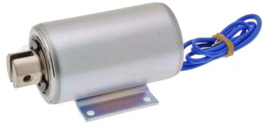
Darstellung im bestromten Zustand